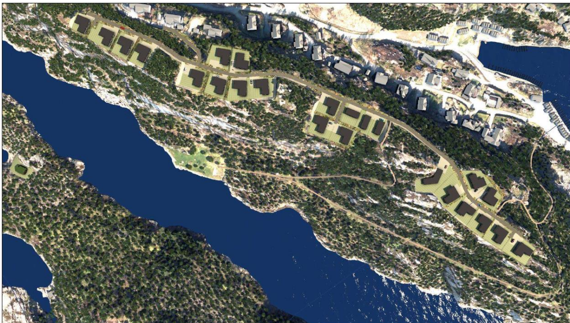
BILDE 1: OVERSIKT PLANOMRÅDET